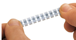
Tira de marcadores WMB extendida.