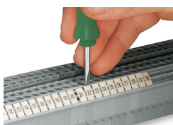
Snapping a marking strip into the marker slot.