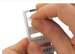
Separación de una tira de la tarjeta de marcaje WBM.