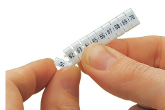
Separación de una etiqueta de inserción individual de la tira de marcadores WBM para usar en bornas más grandes.