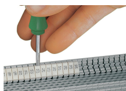
Snapping a WBM marker strip into the marker slot of the double marker carrier.