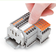
Colocación de tira de marcadores en el soporte de marcaje.